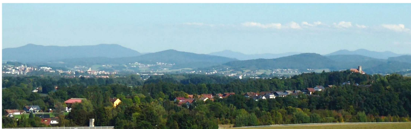
Blick über die Regentalauen und Cham auf die Heimatberge